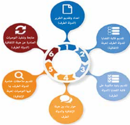
الشكل رقم (1): اجراء تقديم التقارير.

بعد تقديم دولة فلسطين لتقريرها الأولي إلى هيئات المعاهدات والمتعلق بالخطوات والتدابير المتخذة لتنفيذ أحكام المعاهدة ذات الصلة وأي صعوبات واجهتها في هذا الصدد، فإن الأخيرة (باستثناء اللجنة الفرعية لمنع التعذيب، يرجى الرجوع إلى الجزء التالي من هذه النشرة) مفوضة بالنظر في التقارير. على نحو من الاختلاف، فإن لجنة اتفاقية حقوق الطفل، تشمل ولايتها أيضاً اثنين من البروتوكولات الاختيارية للاتفاقية يتعلقان بموضوعين اثنين هما «بيع الأطفال» و «الأطفال والصرع المسلح».